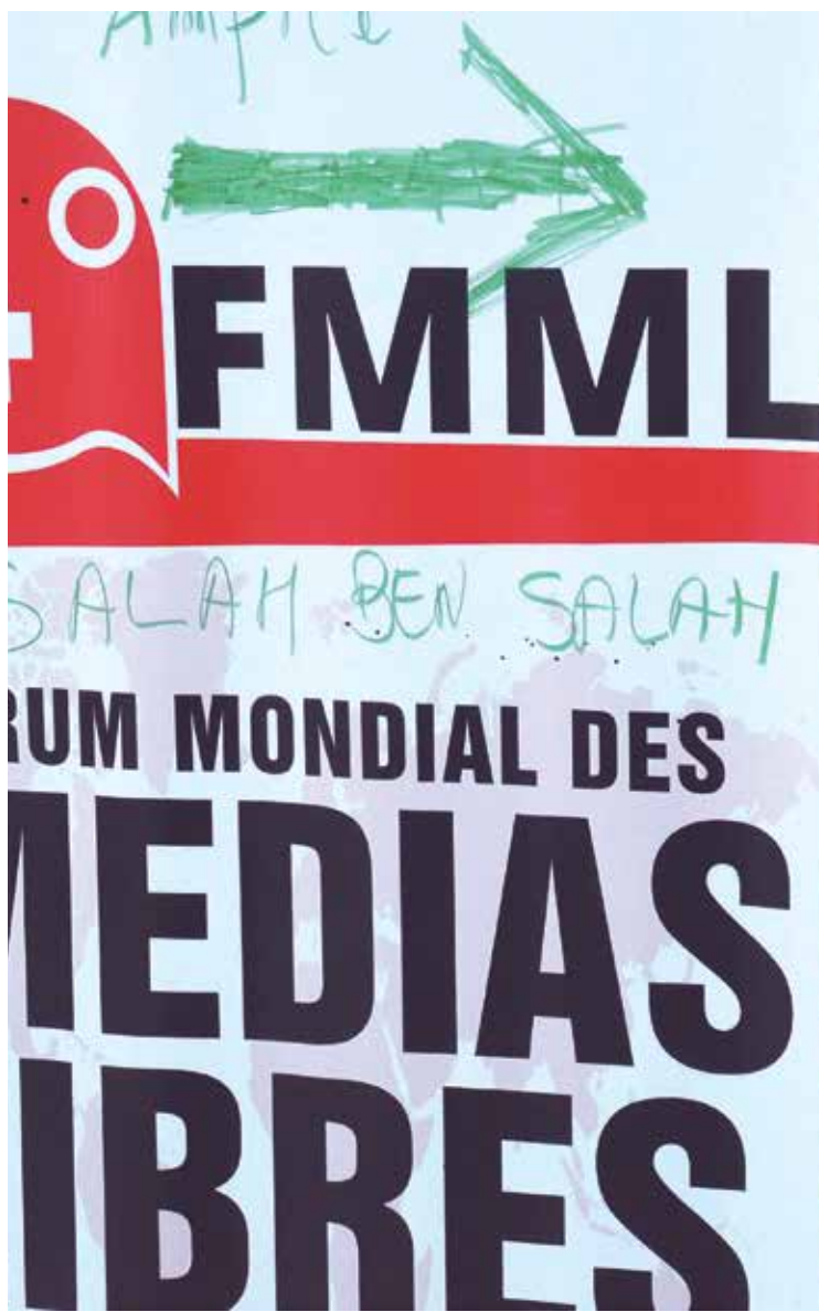
O fórum é realizado em Túnis e participam comunicadores, blogueiros e representantes de movimentos sociais de diversos países

O encontro entre Tsipras e Merkel é considerado por analistas gregos um divisor de águas nas negociações da dívida do país. A expectativa é de que maior entendimento entre as duas nações conduza a uma aceleração nas negociações da dívida grega e à liberação dos 7 bilhões de euros (R$ 24 bilhões) restantes do empréstimo de 240 bilhões de euros (R$ 830 bilhões) feito à Grécia como parte do programa de ajuda ao país.