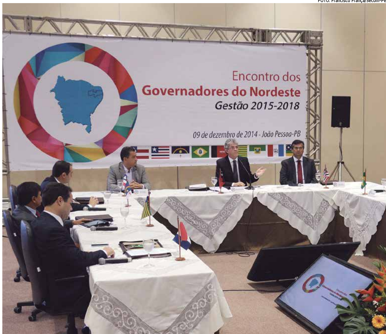
Reivindicações urgentes para o desenvolvimento da região foram elaboradas durante Encontro de Governadores, no fim de 2014

O governador Ricardo Coutinho reafirmou o compromisso com o Estado Democrático de Direito e contra a tentativa de desestabilização econômica e política que "a oposição tenta fazer" no país. "Queremos um Brasil que deixe de falar apenas em crises e fale em desenvolvimento e inclusão social e produtiva", concluiu.