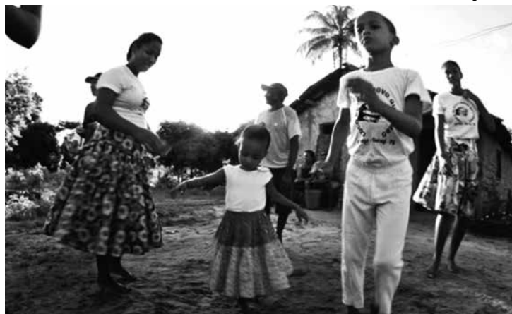
Existem atualmente 140 unidades quilombolas no Estado

Neste mês de março, mês dedicado à mulher, o Fórum de Ciência e Cultura, contemplado pelo Instituto do Patrimônio Histórico e Artístico do Estado (Iphaep), debaterá "A Questão da Mulher Quilombola na Paraíba". O evento, que tem como objetivo aproximar as linguagens científicas e culturais, acontece amanhã, a partir das 15h, no auditório da Iphaep. Na Paraíba, existem 140 unidades quilombolas, a exemplo da comunidade urbana de Paratibe.