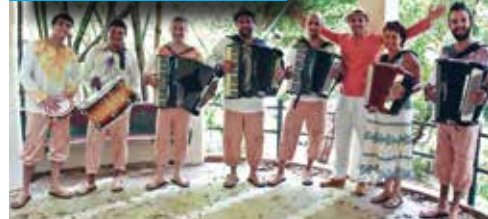
A Orquestra viaja hoje para festival de música