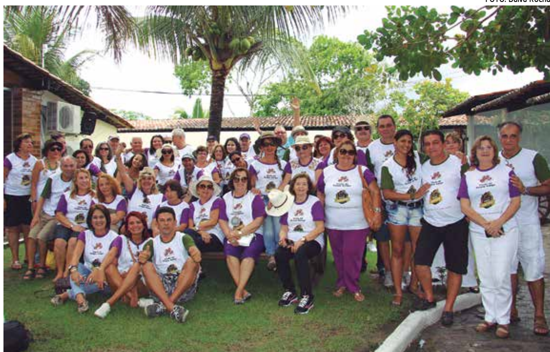
Participantes do último encontro do Clube do Feijão Amigo no Haras Pedra de Fogo