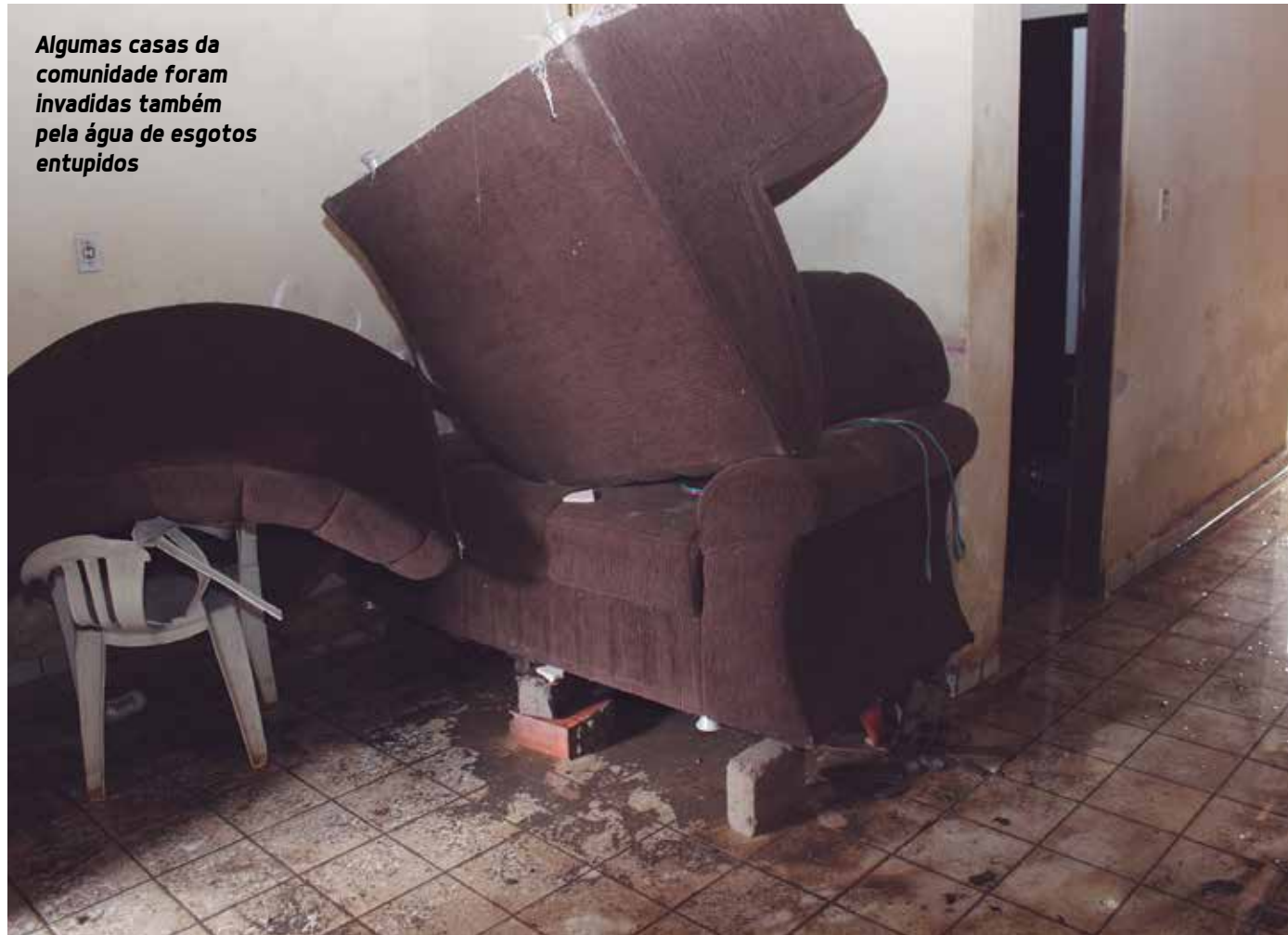
Algumas casas da comunidade foram invadidas também pela água de esgotos entupidos

Os próprios cidadãos podem acionar os agentes de mobilidade em caso de problemas no fluxo de veículos. De segunda a sexta-feira, a Semob disponibiliza uma Central de Reclamações e Informações, que funciona como mecanismo de diálogo entre a população e a superintendência. Em caso de dúvidas, sugestões ou reclamações, o cidadão deve ligar para o número 0800 281 1518.