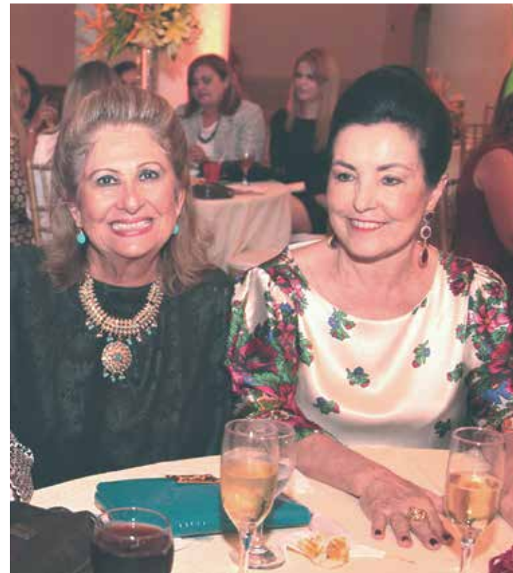
Participantes do último encontro do Clube do Feijão Amigo no Haras