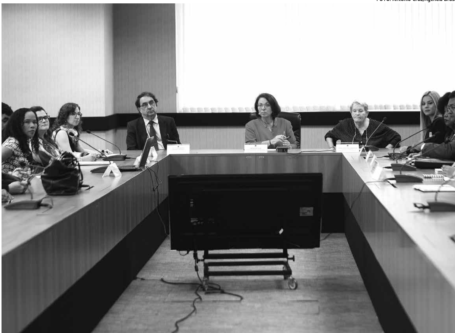
A ministra Ideli Salvatti empossou nove de 11 peritos que vão compor o Mecanismo Nacional de Prevenção e Combate à Tortura

Segundo ela, a demora para implementação do mecanismo no Brasil decorreu do fato de o país ter dimensões e dificuldades diferenciadas, principalmente em algumas unidades da Federação. “Os nove que hoje estão