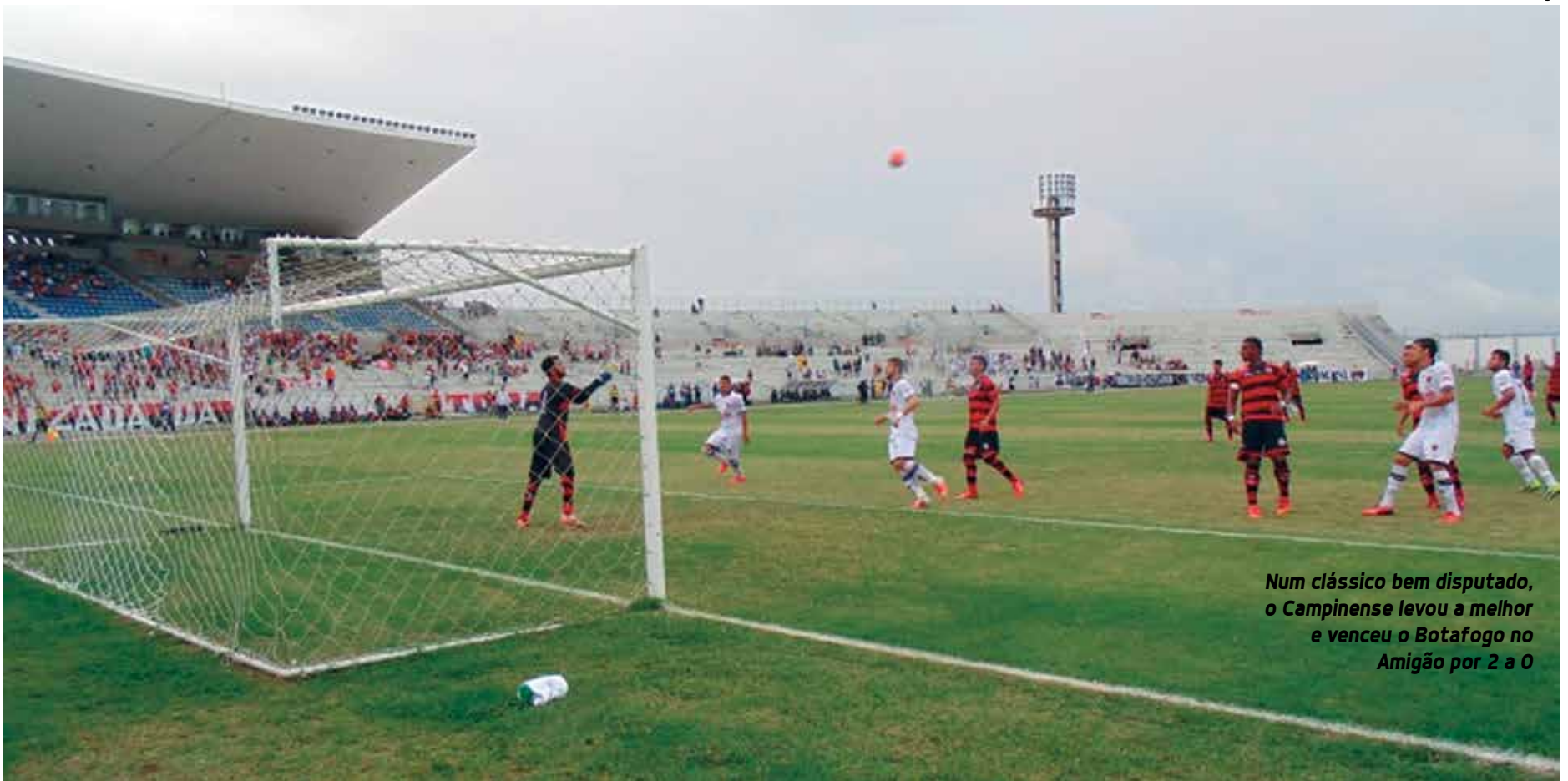
Num clássico bem disputado, o Campinense levou a melhor e venceu o Botafogo no Amigão por 2 a 0

Ingressos para o jogo contra o Bahia só vão ser vendidos a partir de amanhã na loja do clube que fica no Centro