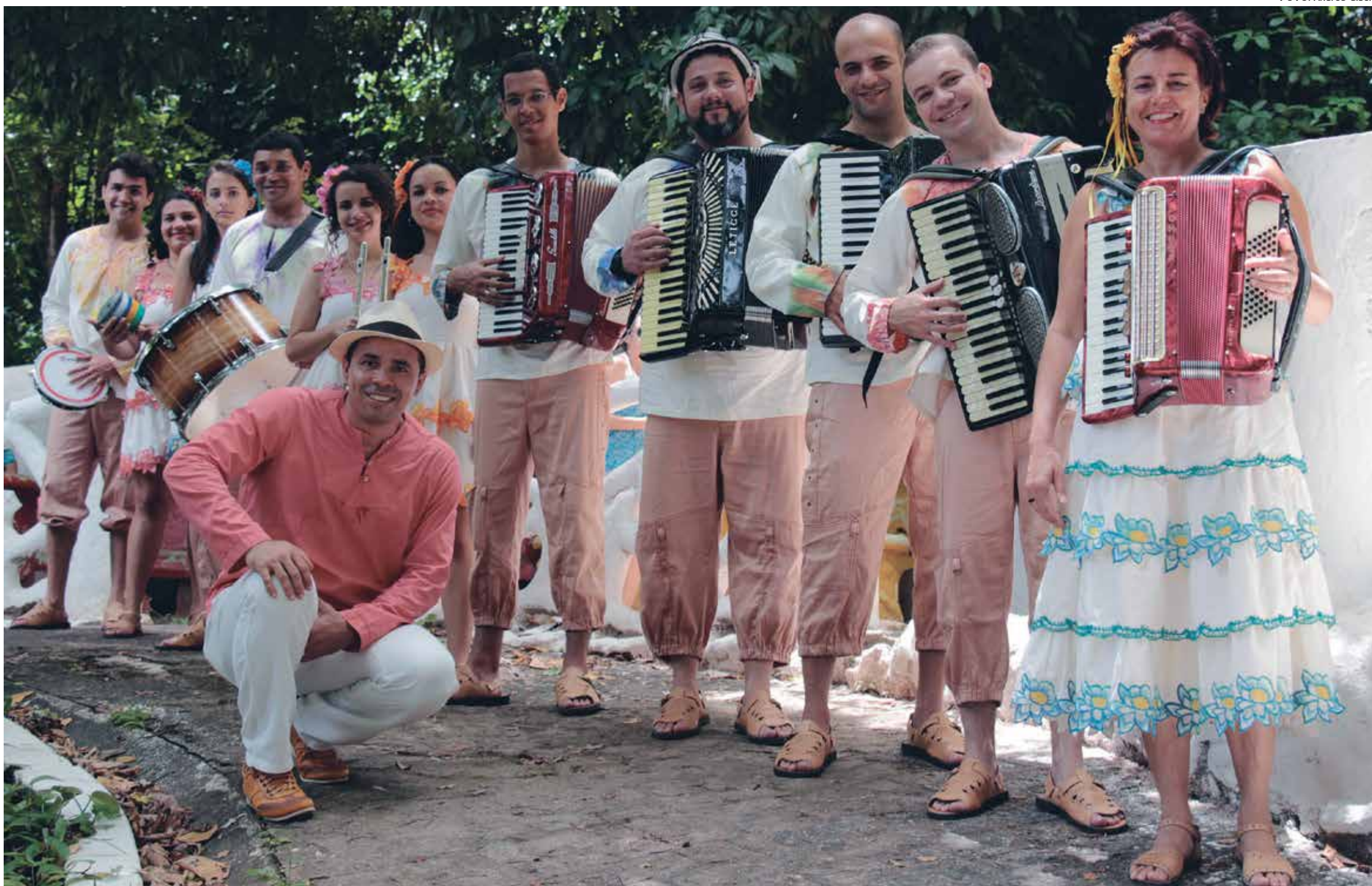
Projeto teve início em 2010 e desenvolve diversas atividades de capacitação, a exemplo de oficinas e cursos, além de intercâmbio cultural com outros estados e países