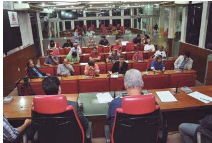
Comissão promoverá audiências a partir da próxima 2ª feira