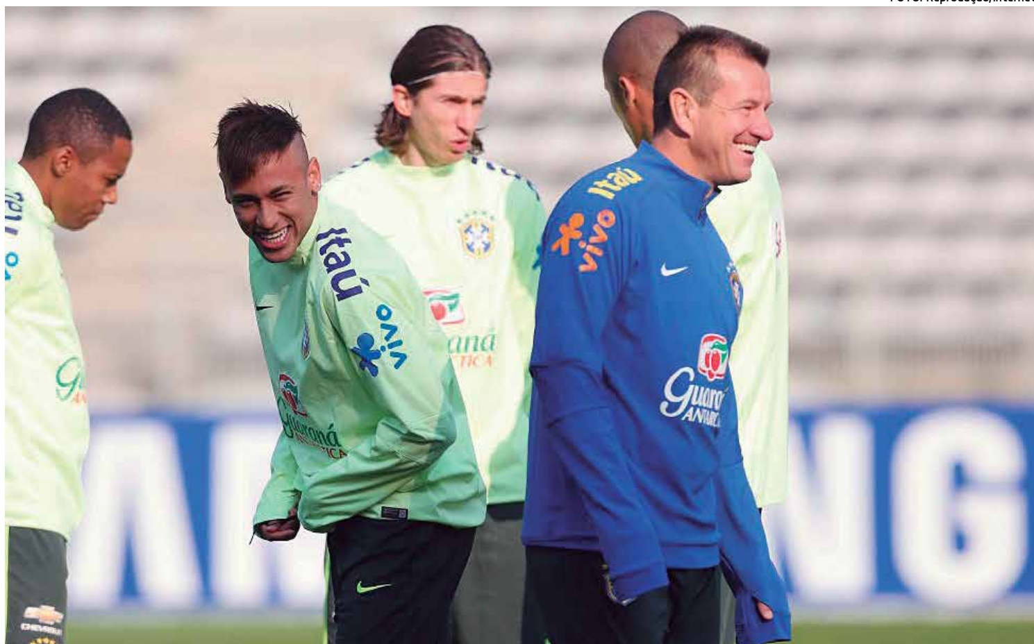
Jogadores da Seleção Brasileira participaram ontem do primeiro treino comandado por Dunga para o amistoso na capital francesa

Inicialmente o técnico dividiu os convocados em três grupos que realizaram exercícios de saída de bola e pequenas rodas de boba. Enquanto isso os goleiros trabalhavam à parte com Taffarel.