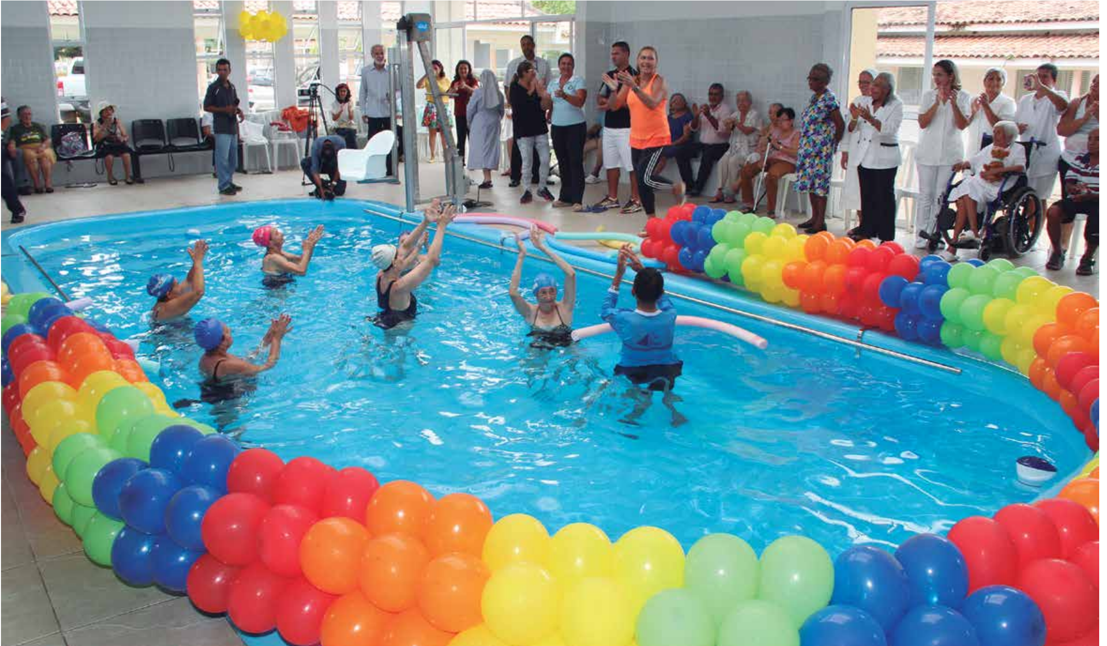
O espaço terapêutico da piscina do Lar da Providência vai servir, não apenas como estímulo para o desenvolvimento de atividades físicas, mas também para as lúdicas e recreativas