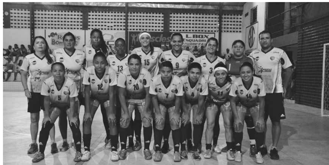
A equipe do Servicar tem presença confirmada na 1ª Taça Nordeste entre os dias 25 e 26 de abril