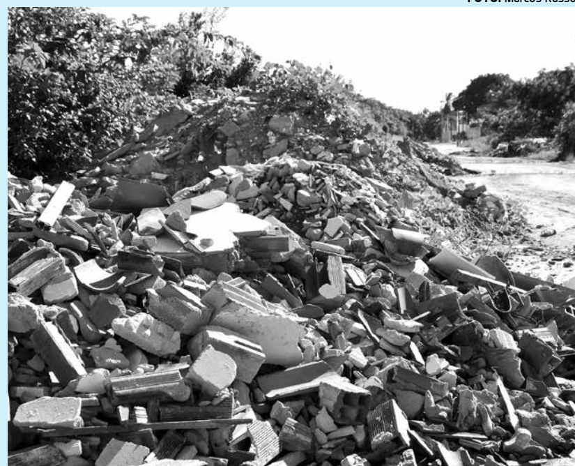
Resolução do Conama prevê a redução dos entulhos da construção civil

A pesquisa envolverá estudantes de Engenharia Ambiental e Sanitária e Engenharia Química da UEPB. Inicialmente, o projeto será desenvolvido no canteiro de obras do residencial Dallas Park, mas a ideia é que seja estendido para as obras da construtora em Caruaru.