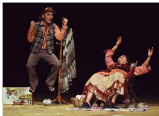
Espectáculo teatral "A Saga de Daluz" e número de dança "Amálgama" fizeram parte da programação de reabertura